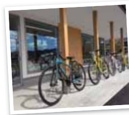
サイクルステーション 女川町たびの情報館「ぶらっと」

女川の人々や海風を感じる特別 な自分だけの時間を過ごせます。 自転車は、走りに特化し本格的 なサイクリングができるロードバイク、 軽い運動や普段使いに適した クロスバイク、坂の多い場所でも 安心の電動アシスト付き自転車から 選んでいただけます。